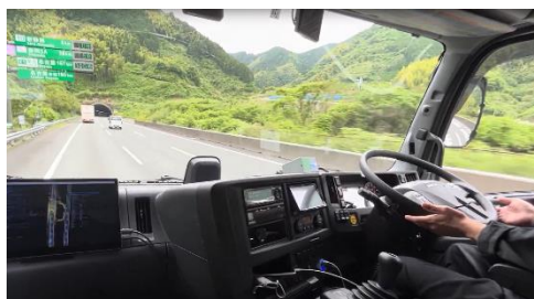
沼津-浜松間の実証実験の様子