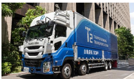
T2 が 5 月より保有する新型車両

今回の実証実験では、政府がデジタルライフライン全国総合整備計画にて自動運転車優先レーンとして位置付けている新東名高速道路の駿河湾沼津 SA-浜松 SA 間(約 117km)を走行しました。